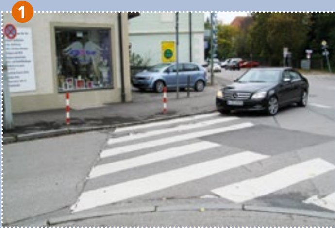
Fußgängerüberweg Johanneskirchner Straße