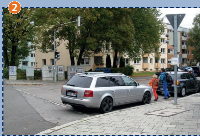
Ampel Bernheimer Straße/Oberföhringer Straße