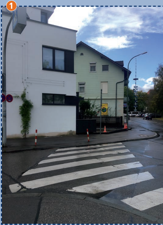
Fußgängerüberweg Johanneskirchner Straße