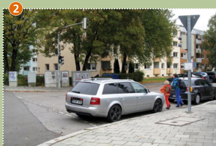
Übergang Bernheimer Straße