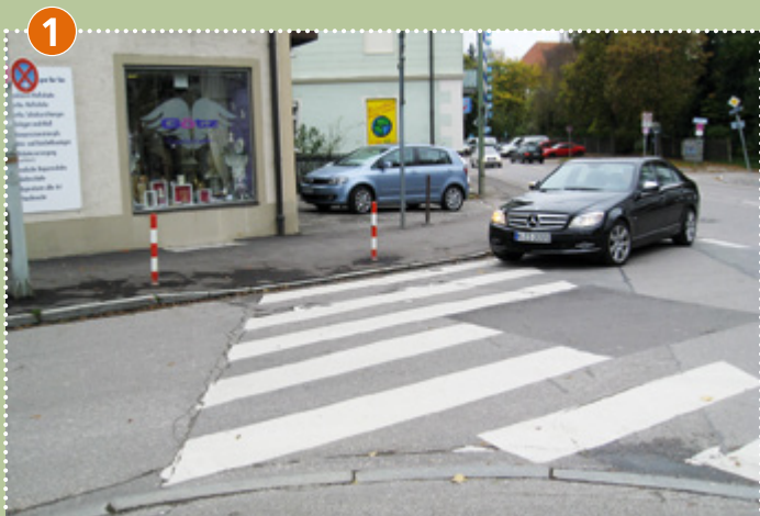
Übergang Johanneskirchner Straße